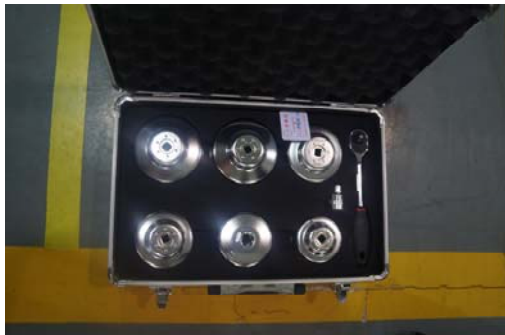
图 1 机滤套装