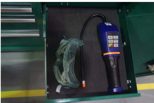
电子式卤素检漏仪（TIFXP-1A）、护目镜。