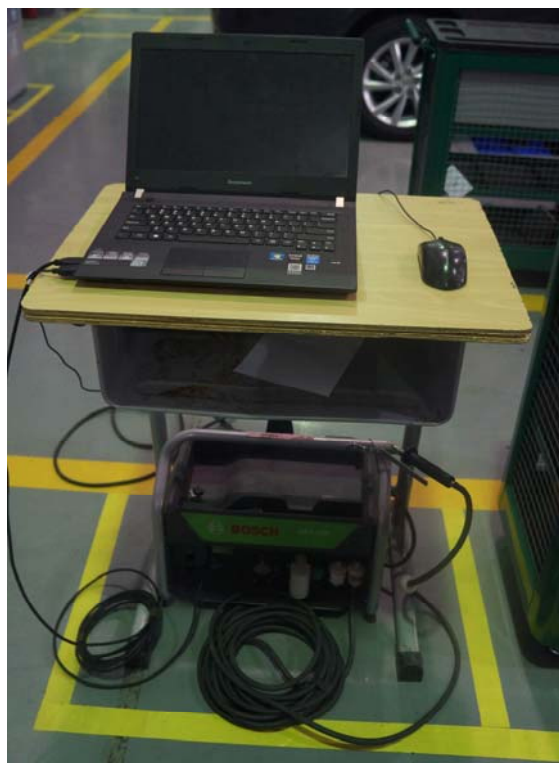
16、尾气分析仪及笔记本电脑照片