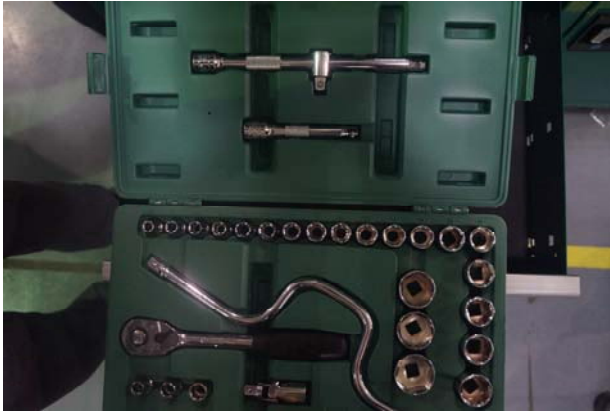
32 件 12.5mm 系列套筒组套（世达 09099）