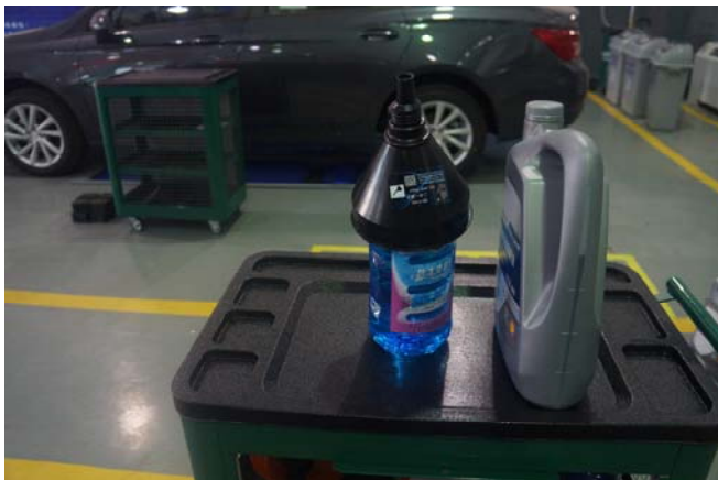
最上层： 漏斗、玻璃水、机油（4L）