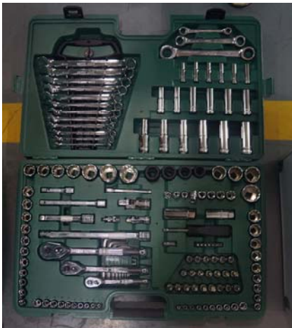
图 2 世达 150 件套